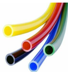
Rys. 2. Przewody elastyczne

Nowe złączki QR1 zapewniają bezpieczne i pewne połączenie komponentów pneumatycznych z elastycznymi przewodami doprowadzającymi sprężone powietrze. Szeroka gama wielkości gwintów przyłączeniowych, średnic przewodów i kształtów typu „T”, „Y”, „X” przyłączy pozwala na szybkie i skuteczne łączenie przewodami dowolnie usytuowanych elementów układu pneumatycznego. Owalny, wygodny w obsłudze pierścień obsady przewodu wykonany z tworzywa POM, nowoczesny kształt korpusu wykonanego z tworzywa PBT, pierścień zacinający wykonany ze stali nierdzewnej, walcowy całowy i metryczny gwint przyłączeniowy oraz perbunanowe uszczelnienie nadają tym produktom znamiona nowoczesności. Złączki QR1 podzielone są na trzy grupy: