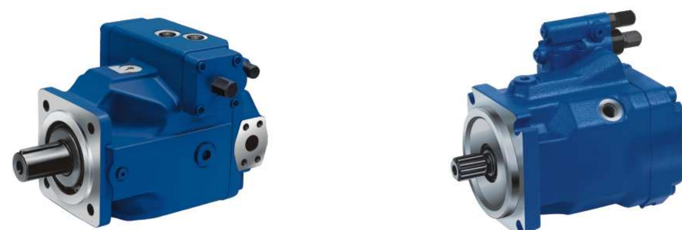
Pompy A4VSO, A10VSO

Klienci: Mittal Steel Polska (Huta Katowice, Huta Florian), Celsa Huta Ostrowiec, Huta Częstochowa, Huta Warszawa, Żłobin Zakład Metalurgiczny – Białoruś, Zakład Metalurgiczny Alchevsk – Ukraina, Zakład Metalurgiczny Niżnij Tagil – Rosja, Huta Miedzi Głogów, Huta Aluminium - Konin