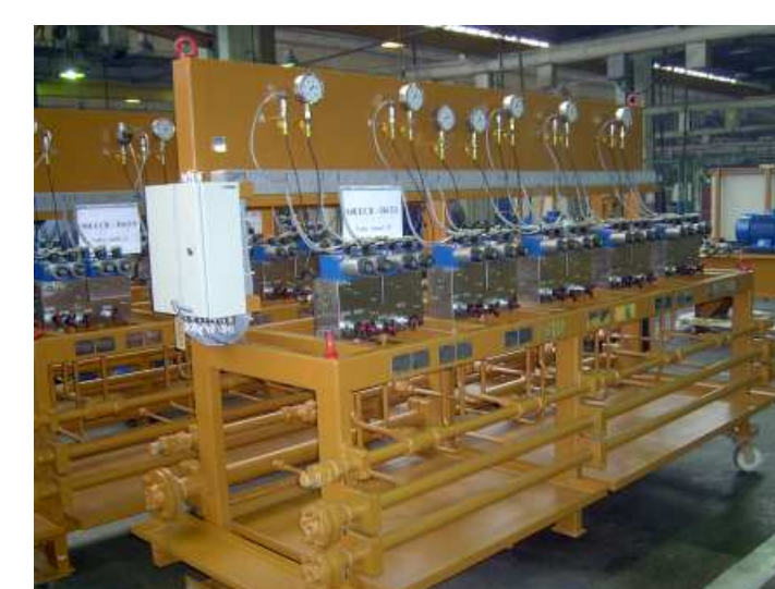
Bloki – stół zaworowy