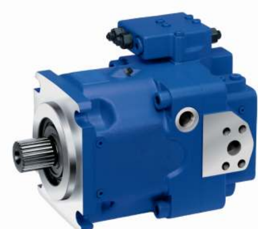
Pompa A11VO, A10VO